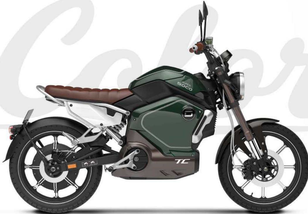
• VINTAŽINĖ ŽALIA

Išskirtinis Café Racer. Būkite stilingas vairuotojas.