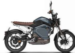
• TAMSI JŪROS MĒLYNA