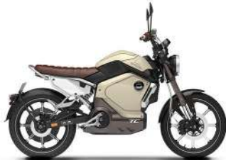
• CHAKI GELTONA